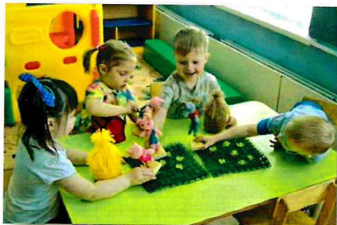
Пальчиковый настольный театр

Учитывая ранний возраст детей, особое значение уделяется подбору пособий. Большую часть игрушек для театра изготавливаем сами.