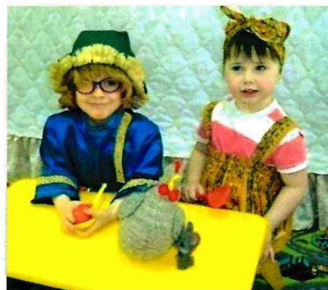
Инсценировка сказки «Курочка Ряба»

Театральная деятельность развивает личность ребенка, способствует возникновению новых для ребенка действий, которые он осваивает со временем.