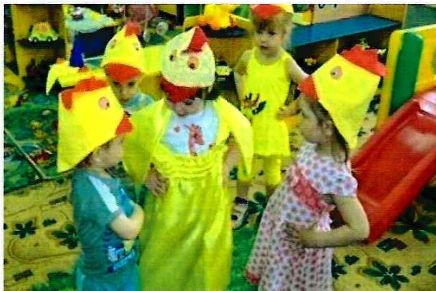
Игра «Вышла курочка гулять»

Играя, ребята много двигаются: бегают, прыгают. Благодаря этому дети растут крепкими, сильными, ловкими. С этой целью проводятся игры: «Вышла курочка гулять», «Мишка косолапый» и другие. Дети любят сказки и рассказы, развивающие у них фантазию, усиливающие интерес к литературному жанру. Малыши могут много раз слушать одно и то же произведение, запоминают его наизусть, часто играют в сказку.