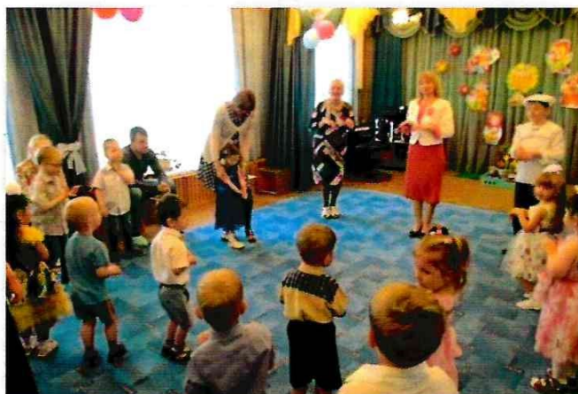
Итоговый праздник «До свидания, игрушки»

Играя вместе, дети учатся жить дружно, уступать друг другу, заботиться о товарищах.