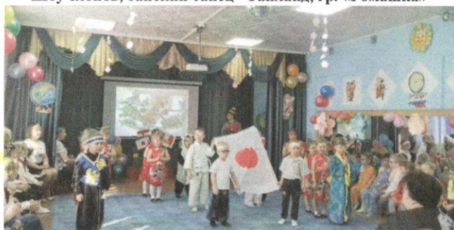
Праздничное шествие, танец – Япония, гр. «Сморозинка»