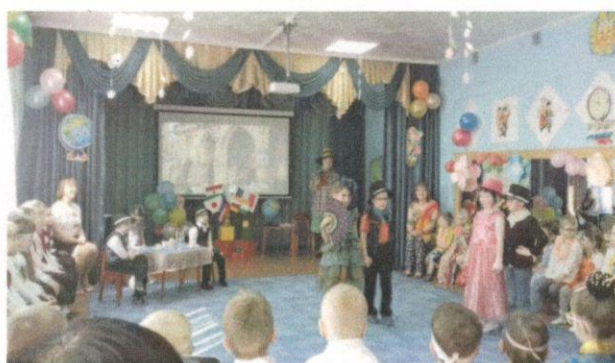
Дефиле «Высокая мода» – Франция, гр. «Одуванчик»