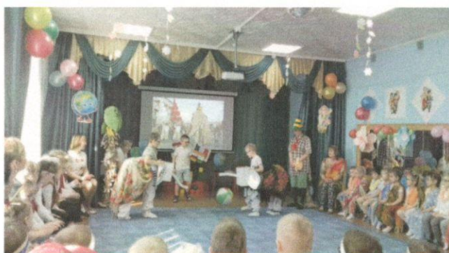
Шоу слонов, тайский танец –Тайланд, гр. «Ромашка»