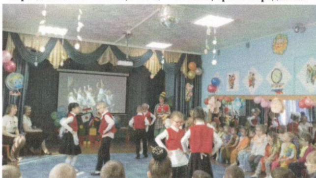
Немецкая полька и игра - Германия, гр «Незабудка»