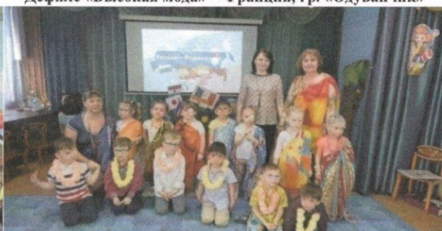
Танец «Джимми-Джимми» и игра – Индия, гр.«Василёк»