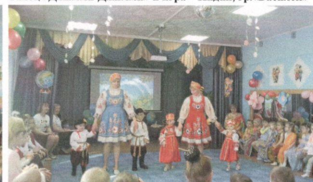
Русские и африканские народные танцы, гр. «Ягодка»